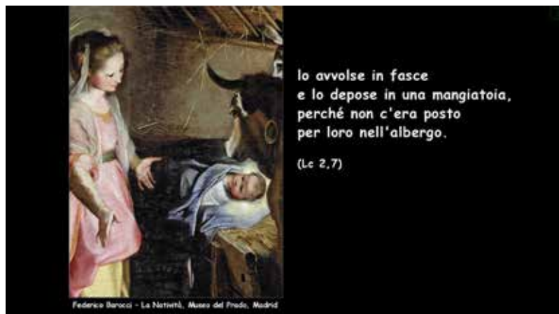
Federico Barocci - La Natività, Museo del Prado, Madrid

Laureata con lode nel 2002 in Filosofia presso l'Università Cattolica del Sacro Cuore di Milano, dal 2010 al 2014 ha frequentato i corsi dell'Istituto Superiore di Scienze Religiose di Milano. Nel 2009 ha dato vita a ComunicArte per raccontare l'arte che "in-segna" e rivela quella bellezza che è splendore del vero. Gli studi classici, la laurea in Filosofia e gli approfondimenti teologici le permettono di presentare i grandi cicli dell'arte sacra o le opere di alcuni artisti con rigore e competenza. La tecnica di zoom che ha perfezionato le permette di "entrare" nei dettagli delle singole immagini con grande efficacia comunicativa. Dal 2018 è docente di Storia e Filosofia presso ITSOS Marie Curie a Cernusco sul Naviglio (MI).