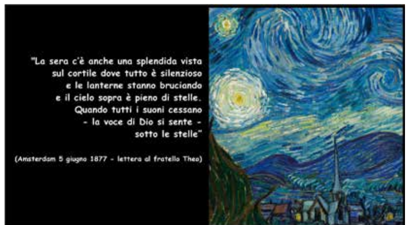
(Amsterdam 5 giugno 1877 - lettera al fratello Theo)