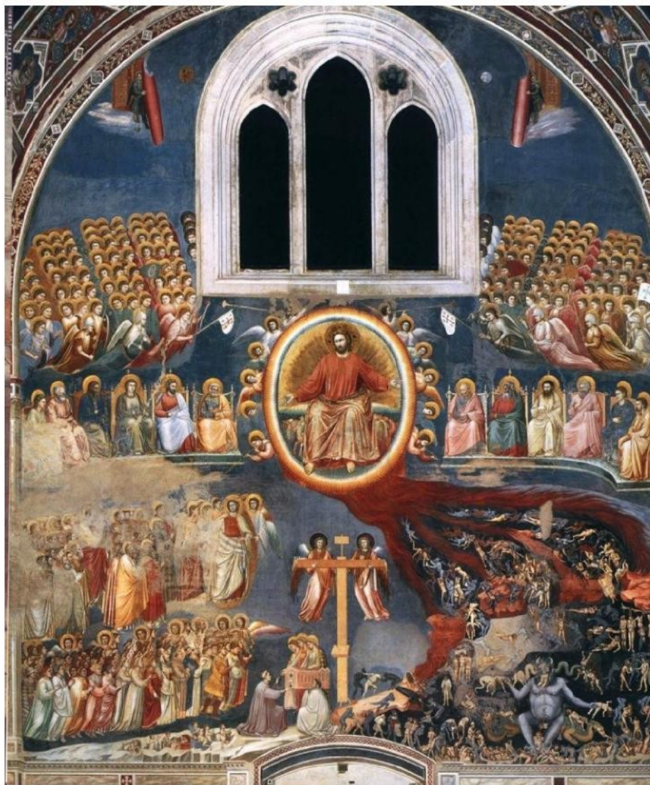
Giotto, Giudizio Universale, 1303-1305, Cappella Scrovegni, Padova

Storie della Settimana Santa e della Pasqua. “Ho combattuto la buona battaglia, ho terminato la mia corsa, ho conservato la fede”.