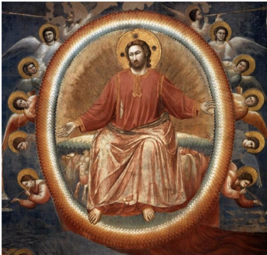
Giotto, Giudizio Universale , particolare centrale

Chi, infatti, dal portale doveva entrare nella Cappella, vedeva il Padre misericordioso, che invia l'Arcangelo Gabriele a Maria, ma uscendo, dopo aver meditato tutti i Misteri della Salvezza cui il Battezzato è chiamato, era sollecitato alla contemplazione del fine con nel cuore i sentimenti di Paolo: